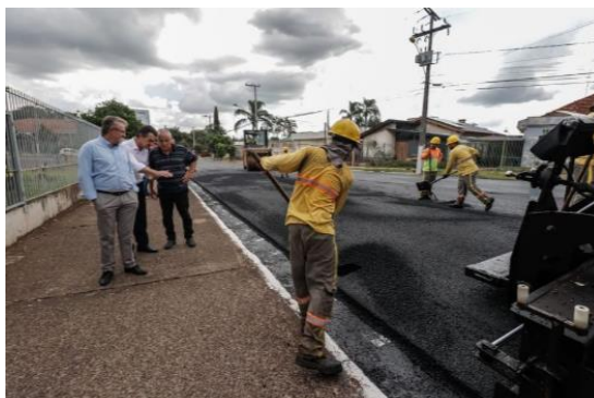
Imagem 2 - Vistoria da obra de pavimentação do Programa Caminhos da Escola

Visitado por milhares de fiéis ao longo do ano, as ruas do entorno do Santuário Coração de Jesus, onde está o túmulo do Padre Reus, receberam um novo capeamento asfáltico, na sexta-feira, 24 de março. Além de fiéis e turistas, moradores do bairro utilizam diariamente as vias para locomoção. Foram beneficiadas as ruas Padre Werner e Leonel França. “É a continuação de uma série de obras que estamos realizando desde o início do ano. Começou com o Programa Caminho das Escolas, seguiu com demais obras estruturantes e agora estamos num ponto religioso e turístico, frequentado por milhares de pessoas”, destacou o prefeito Ary Vanazzi, que acompanhou de perto o trabalho na tarde desta sexta-feira, dia 24. (São Leopoldo, 2023) 6 .